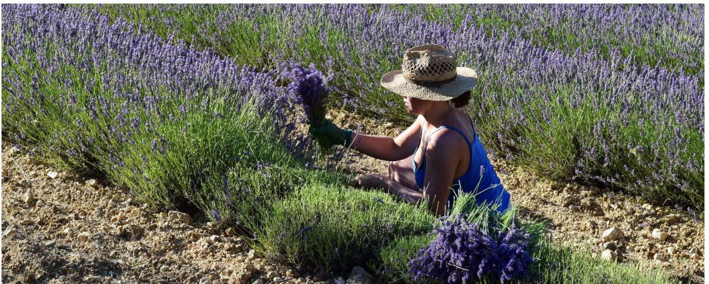
Nous récoltons nos plantes à la serpette